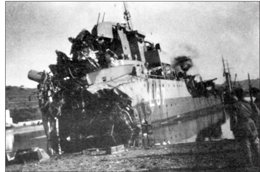
Το αντιτορπιλικό «Αδρίας», με αποκομμένη την πλώρη, προσαραγμένο στο Γκιουμουσλούκ.

πρώρη, γιατί εκεί ήτο η κλίνη μου. Εάν γινόνταν μετά από μία ώρα, τότε θα ευρισκόμουν και εγώ μαζί με τους μακαρίτες!